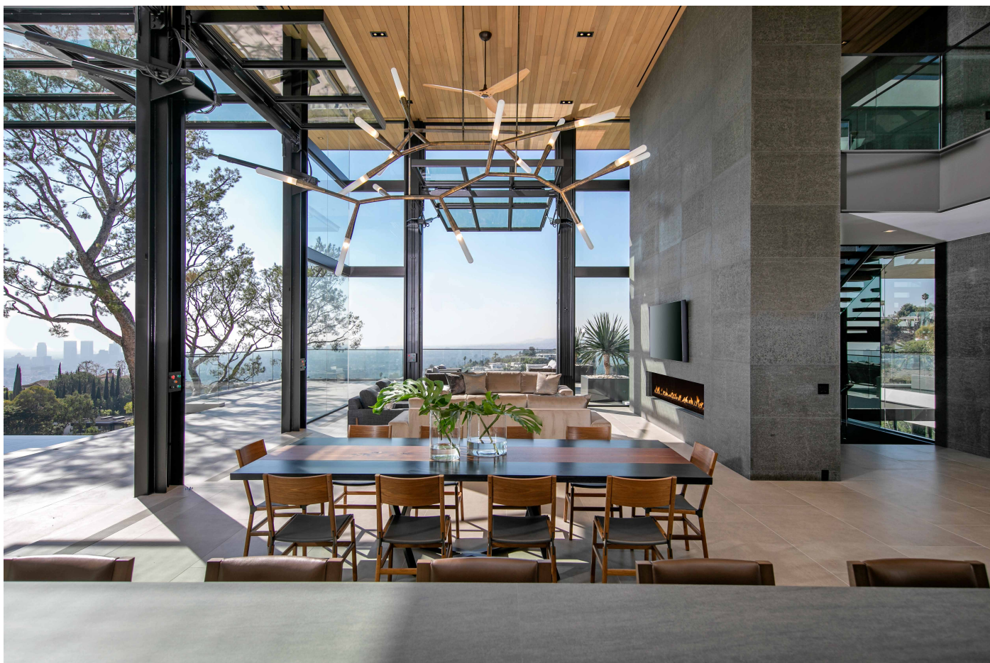
Enorma fönster fyller huset med naturligt ljus.

ARKITEKTEN SJÄLV BESKRIVER huset som en öppen historia, med en aningen industriell känsla som bland annat är synlig i de stålkolumner som ramar in de gigantiska glasväggarna. Just glasväggarna bidrar starkt till den öppna känslan och låter det berömda kaliforniska ljuset strömma in från alla håll. Flera av glasväggarna går också att skjuta åt sidan, för att verkligen ta vara på det härligt soliga klimatet.