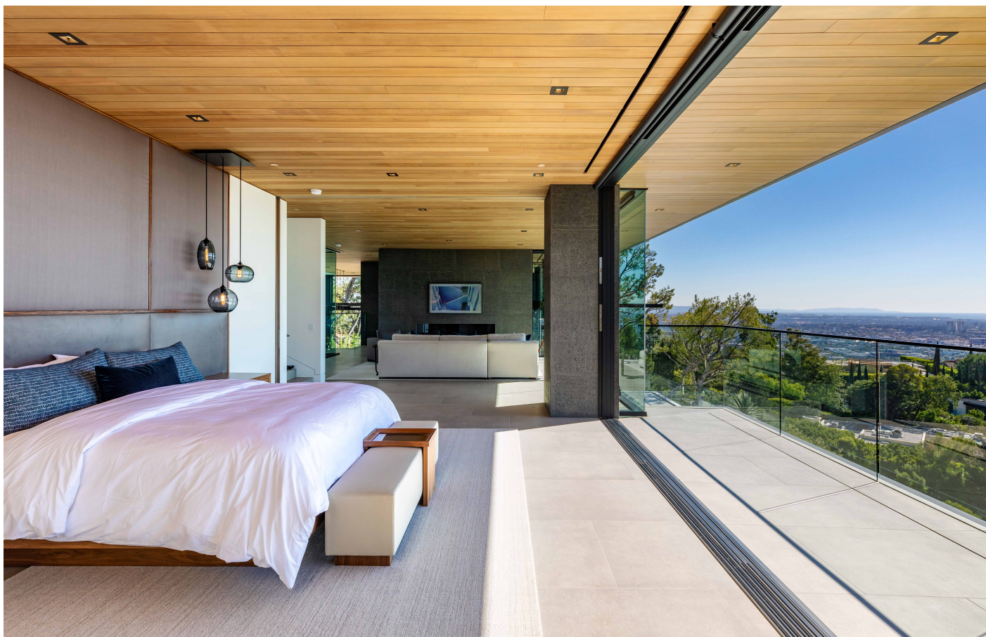
Glasväggen i sovrummet går att skjuta åt sidan.

SKYLARK LANE, SOM fått sitt namn efter gatans skönsjungande sånglärkor, tillhör det mytomspunna område som brukar kallas för "Bird Streets". I dessa exklusiva kvarter har celebriteter flockats i decennier – till exempel hade både Elvis Presley och Frank Sinatra hus här under sina glansdagar. Idag har nutida megastjärnor som Christina Aguilera och Jennifer Aniston slagit ned sina bopålar i området.