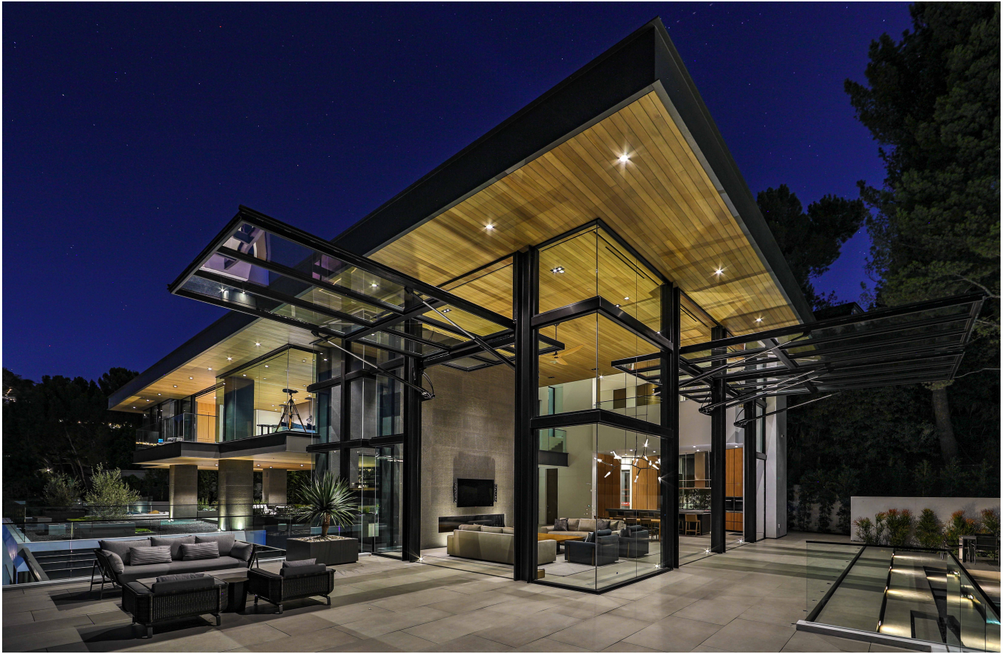
När mörkret faller blir det tydligt hur enorma husets glaspartier är.