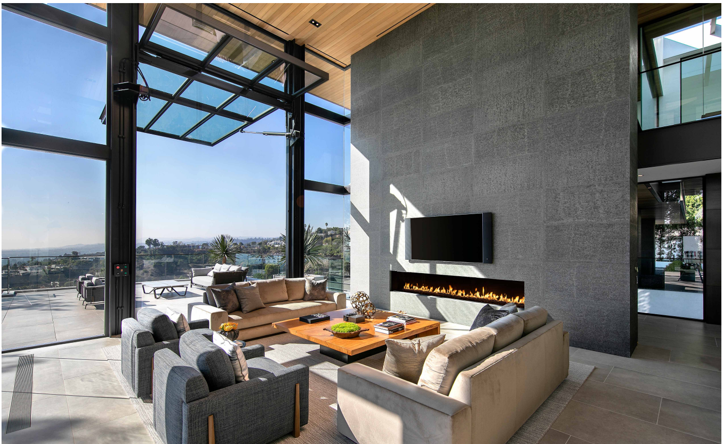
Den stora öppna spisen är en naturlig samlingspunkt i vardagsrummet.